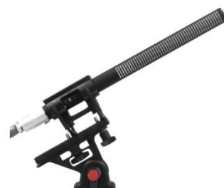
CS-2 (подвес в комплект не входит)

Узкая направленность и выдающаяся чувствительность (63мВ/Па) позволяют качественно снимать звук с больших расстояний. Это открывает новые возможности для репортажной работы.